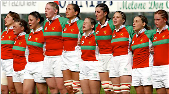
Red Panthers - Treviso